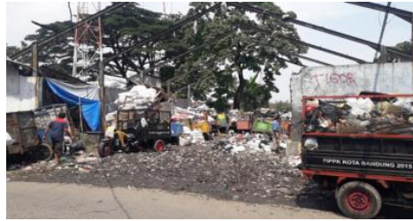
Gambar 2. Tempat Pembuangan Akhir (TPA) Sampah Sukapura