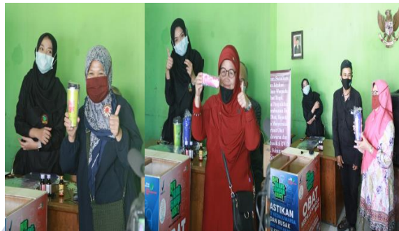
Gambar 7. Kegiatan Program “Gerakan Buang Sampah Obat Kedaluwarsa dan Rusak” di Kantor RW 01 Kelurahan Sukapura