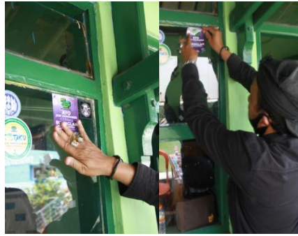
Gambar 6. Penempelan Stiker Program “Gerakan Buang Sampah Obat Kedaluwarsa dan Rusak”