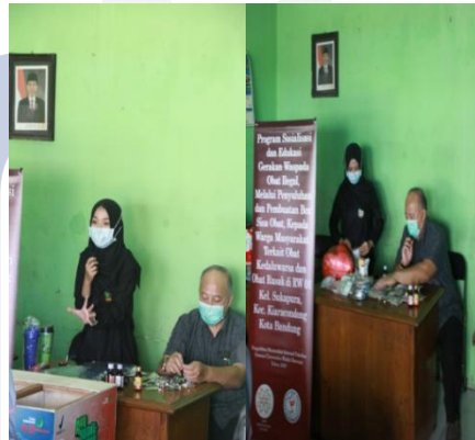
Gambar 4. Demonstrasi Cara Memilah dan Memilih obat sisa/kedaluwarsa/rusak