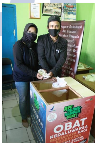
Gambar 5. Pembuatan Dropbox Sampah Obat