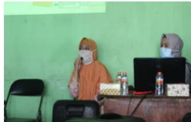
Gambar 3. Penjelasan Materi Melalui Oral Persentation