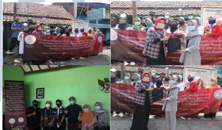
Gambar 8. Foto Bersama Pengabdian Masyarakat Program “Gerakan Buang Sampah Obat Kedaluwarsa dan Rusak”