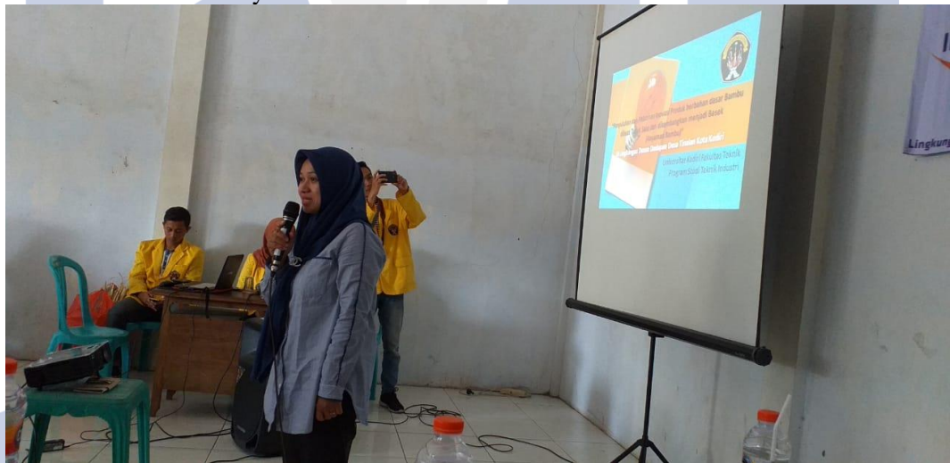
Gambar 2. Penyuluhan dari Dosen Prodi Teknik Industri