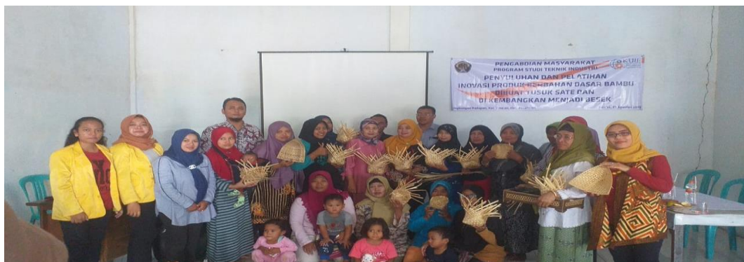
Gambar 3. Pelatihan pembuatan besek oleh pelatih