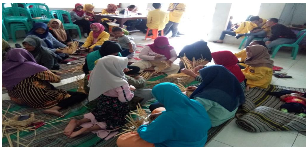
Gambar 4. Pelatihan pembuatan besek oleh pelatih dibantu oleh mahasiswa