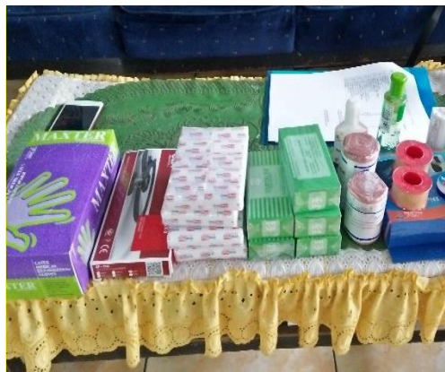
Gambar 6. Peralatan kesehatan

Kegiatan berikutnya adalah pengadaan barang berupa obat dan peralatan kesehatan sederhana dilakukan oleh tim abdimas selama kurang lebih dua minggu. Obat yang diberikan berupa obat luar untuk menangani luka dan beberapa obat sirup yang dijual bebas. Adapaun untuk peralatan kesehatan yang dimaksud adalah peralatan untuk rawat luka dan peralatan untuk menangani cedera sederhana, misalnya elastic bandage. Alat dan obat tersebut diharapkan dapat segera digunakan apabila ada kondisi cedera yang memerlukan pertolongan segera dari guru maupun pembina UKS.