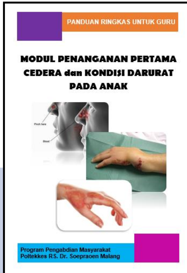
Gambar 6. Modul Penanganan Pertama Cedera dan Kondisi Darurat Pada Anak