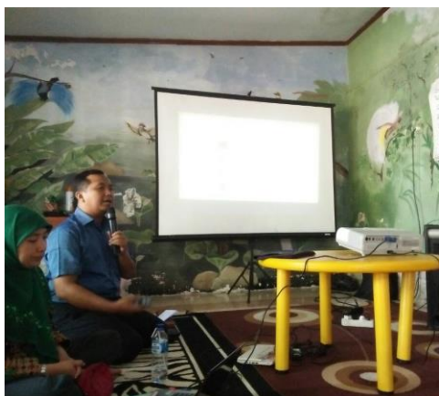
Gambar 1. Penyampaian materi seminar