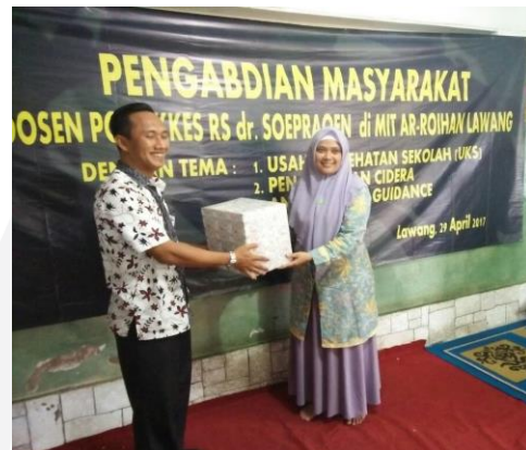
Gambar 7. Penyerahan obat dan peralatan kesehatan sederhana kepada mitra