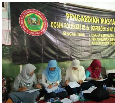
Gambar 2. Peserta Seminar Mengerjakan Pretest