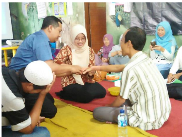
Gambar 4. Proses Pendampingan Praktik Penanganan Cedera dan Kondisi Kedaruratan Pada Anak

Sebelum para peserta diajarkan praktik penanganan cedera dan kondisi ke daruratan pada anak, peserta di lakukan pretest terlebih dahulu. Hal tersebut dilakukan untuk mengukur kemampuan dasar peserta sekaligus mengidentifikasi kesalahan-kesalahan yang sering dilakukan selama penanganan cedera dan kondisi ke daruratan pada anak. Salah satu anggota Abdimas melakukan penilaian secara observasi dengan menggunakan SOP penanganan cedera dan kondisi ke daruratan pada anak.