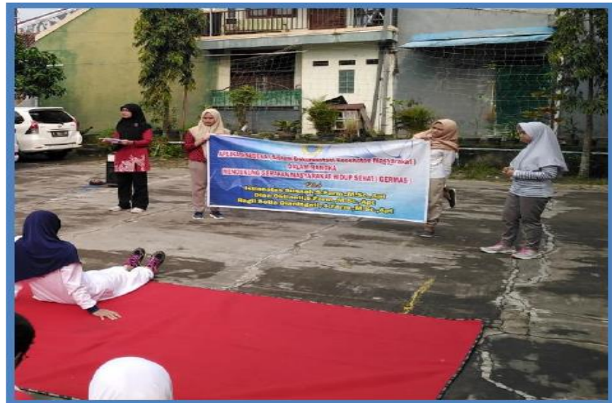
Gambar 3.2. Kegiatan penyampaian materi

Hasil rekapitulasi nilai pretes dan postes, menunjukkan adanya peningkatan pemahaman peserta setelah diberikan materi. Pemahaman peserta meningkat menjadi “BAIK” bahkan menjadi “SANGAT BAIK” setelah diberikan materi. Hal ini menunjukkan bahwa terdapat perubahan yang signifikan terhadap pemahaman peserta tentang penyakit degeneratif dan aplikasi SEDEKA. Pada diagram gambar (3.3) menunjukkan adanya peningkatan prosentase rata-rata nilai baik pada materi hipertensi, DM dan kolesterol. Pada materi hipertensi rata-rata nilai postes peserta menjadi meningkat 100 % setelah materi hipertensi diberikan. Berdasarkan hasil tersebut, pemahaman peserta setelah diberikan materi dapat dikategorikan meningkat menjadi “BAIK”. Untuk materi diabetes mellitus terdapat peningkatan yang cukup signifikan terhadap pemahaman peserta. Terjadi peningkatan nilai sebesar 27,88%, setelah materi diberikan. Berdasarkan data tersebut, peserta awalnya telah memahami tentang diabetes mellitus mulai dari pengertian, penyebab, terapi dan monitoring penyakit tersebut, dengan adanya pemaparan materi tersebut, peserta menjadi sangat paham dan dapat dikategorikan pemahamannya SANGAT BAIK tentang penyakit diabetes mellitus.