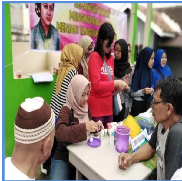
Gambar 3.1. Kegiatan pengecekan kadar gula darah di posyandu lansia

darahnya selalu terkontrol dan termonitor (Marinda, Suwandi and Karyus, 2016). Kegiatan Pengabdian kepada Masyarakat, dilaksanakan bersamaan dengan kegiatan rutin lansia yaitu senam sehat dan posyandu lansia. Acara diawali dengan cek kesehatan lansia meliputi pengukuran tekanan darah, penimbangan berat badan, pengukuran kadar gula darah, kolesterol dan asam urat, dilanjutkan dengan senam lansia dan senam anti hipertensi. Sebanyak 44 peserta kegiatan ini, adalah lansia warga Desa Lerep, melakukan pengisian pretes yang bertujuan untuk mengevaluasi tingkat pemahaman dan pengetahuan lansia tentang penyakit hipertensi, Diabetes Mellitus dan hiperkolesterolemia serta aplikasi SEDEKA. Pretest terdiri dari 10 pertanyaan tentang ketiga penyakit degeneratif tersebut.