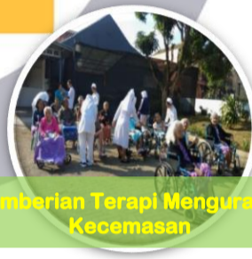
Pemberian Terapi Mengurangi Kecemasan